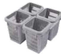
Korpa za escajg, 4-struka Br.art.: 4700801300