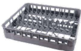
Korpa za tanjire 50 x 60 plastična Br.art.: 4700800900