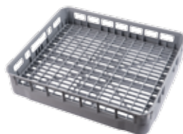
Korpa za čaše 50 x 60, plastična Br.art.: 4700800300