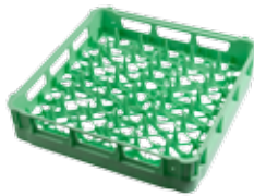
Plastična košara za krožnike 50 x 50 št. art.: 4700800800