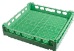
Univerzalna plastična košara 50 x 50 št. art.: 4700801100