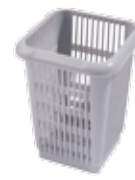
Posamična košara za pribor št. art.: 4700801200