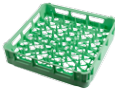
Кошници за чинии 50 x 50 пластмаса Арт. №: 4700800800