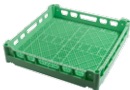
Универсална кошница 50 x 50 пластмаса Арт. №: 4700801100