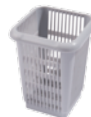
Кошница за прибори поотделно Арт. №: 4700801200