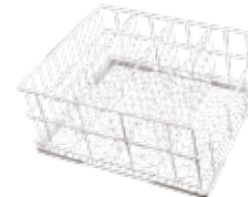
Korpa za čaše, 4-delna, nagnuta 40 Br.art.: 4700800700