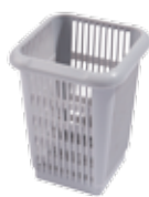
Pojedinačna korpa za escajg Br.art.: 4700801200