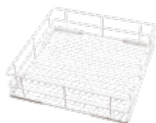
Korpa za čaše 40, metalna Br.art.: 4700800100