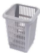
Košara za pribor za jelo pojedinačna br. art.: 4700801200