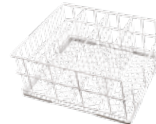
Košara za čaše 4-dijelna nagnuta 40 br. art.: 4700800700