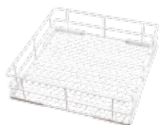
Košara za čaše 40 metalna br. art.: 4700800100