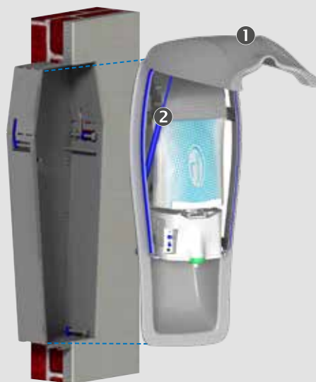
1 Unverwüstliches Edelstahlgehäuse

Der Einbau der intelligenten Edelstahlspender in jede Wand ergibt ein einzigartiges Raumbild. Ob Massivwände, Ytong, Holzkonstruktionen, Trockenbau, Glas oder Metall – mit dem Einbaurahmen aus Edelstahl lassen sich die