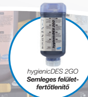
hygienicDES 2GO Semleges felület- fertőtlenítő