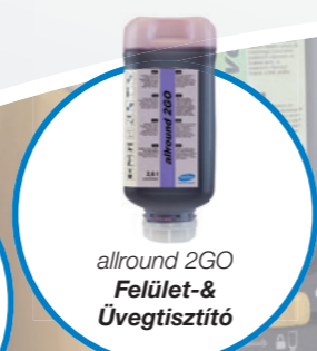
allround 2GO Felület- & Üvegtisztító