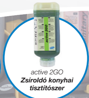
active 2GO Zsíroltó konyhai tisztítószer