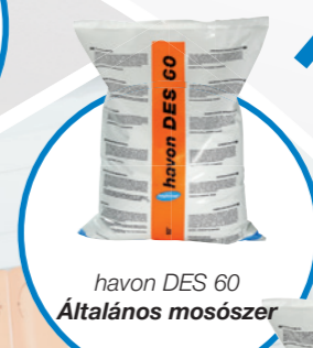
havon DES 60 Általános mosószer