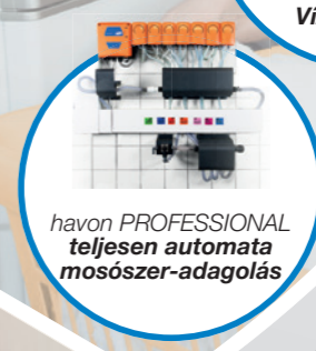
havon PROFESSIONAL teljesen automata mosószer-adagolás