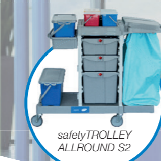
safetyTROLLEY ALLROUND S2