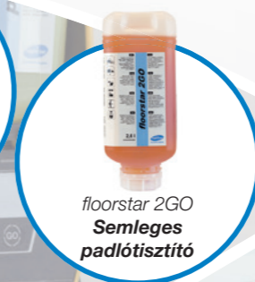
floorstar 2GO Semleges padló tisztító