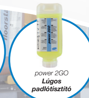
power 2GO Lúgos padló tisztító