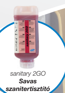
sanitary 2GO Savas szanitertisztító