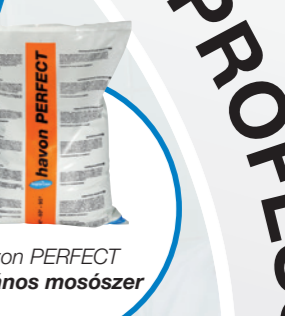
havon PERFECT Általános mosószer