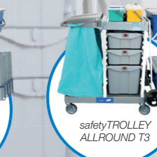
safetyTROLLEY ALLROUND T3