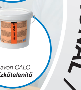
havon CALC Vízkötelenítő