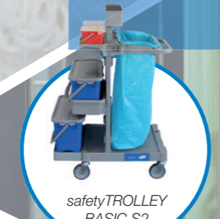
safetyTROLLEY BASIC S2