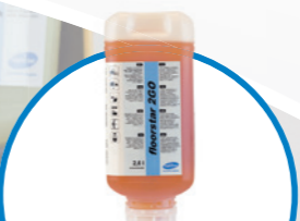
floorstar 2GO неутрален препарат за почистване на подове