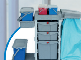
safetyTROLLEY ALLROUND S2 количка за почистване