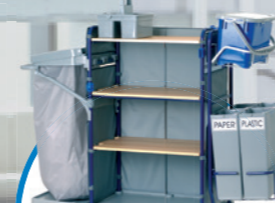
safetyTROLLEY ROOM количка за почистване