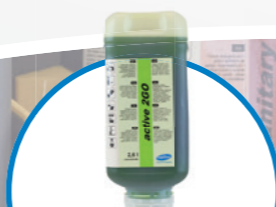
active 2GO Разтварящ мазнини препарат за почистване на кухни