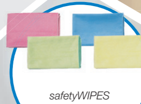
safetyWIPES универсални почистващи кърпи