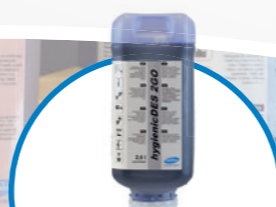
hygienicDES 2GO Неутрален дезинфектант за повърхности