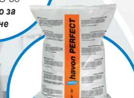
havon PERFECT средство за изпиране