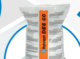
havon DES 60 средство за изпиране