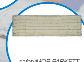
safetyMOP PARKETT моп