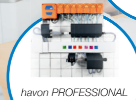
havon PROFESSIONAL напълно автоматична дозираща система за изпиране