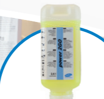
power 2GO алкален препарат за почистване на подове