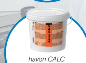
havon CALC средство за омекотяване на вода

Концентриран, устойчив, почистващият препарат е дозиран точно