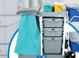
safetyTROLLEY ALLROUND T3 количка за почистване