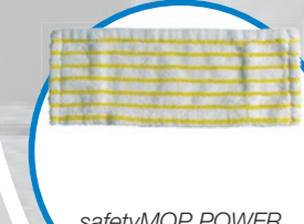
safetyMOP POWER моп