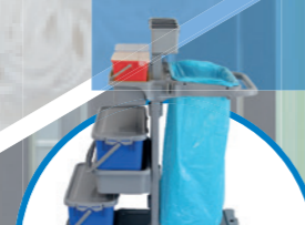
safetyTROLLEY BASIC S2 почистваща количка