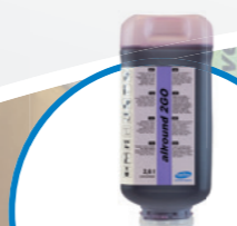
allround 2GO Препарат за почистване на гладки и стъклени повърхности