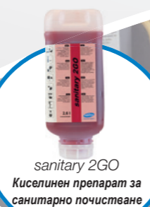
sanitary 2GO Киселинен препарат за санитарно почистване