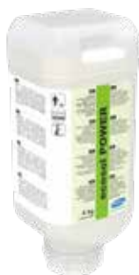
Veľmi hustý tekutý koncentrát