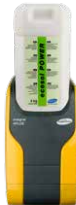
Дозираща технология за търговски съдомиялни машини