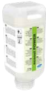
Течен, силно концентриран препарат