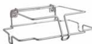
hup fali tartó