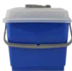
hup BOX blue

1 db, keresztfejes fedéllelCikkszám: 4431202700