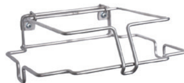
hup držalo za stenu