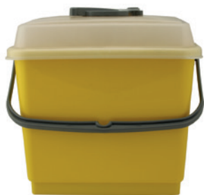
hup BOX yellow